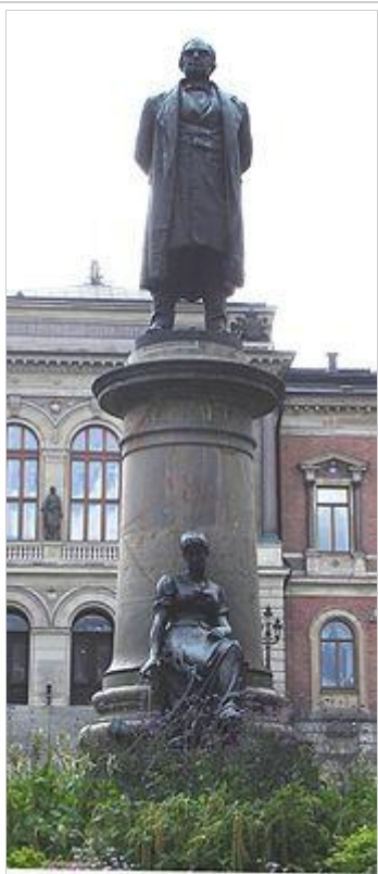
Staty av Geijer i Universitetsparken i Uppsala

också nära vän med sin gamle studiekamrat Atterbom och dessa båda kom att prägla den svenska romantiken och göra den allmänt spridd, kanske mera än någon annan romantiker.