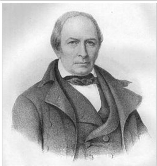
Erik Gustaf Geijer på ett litografi från 1840-talet.

bestå i att han inte längre trodde på den organiska samhällsordningen. Eftersom han snart tog avstånd från renodlad individualism och vad han såg som industrialismens konsekvenser, har hans egentliga liberala period ibland sagts vara endast en kort tid, och till den religionskritik som framfördes i utlandet av liberaler som Ludwig Feuerbach och David Strauss ställde han sig avvisande, vilkas påståenden han ansträngde sig till det yttersta för att bemöta. Likaså till den sekularism som liberalismen ofta är förknippad med, var han främmande, och han förfäktade tvärt om nödvändigheten av att samhället byggdes på kristen grund. Han löste det liberala dilemmat som Feuerbachs och Strauss kristendomskritik väckte, genom en nyorientering i sin egen religiositet som gick starkt ut ur kampen.