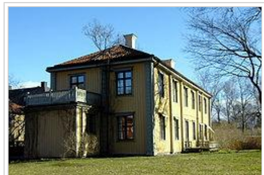
Geijersgården i Uppsala. Erik Gustaf Geijers hem åren 1837-1846.

Trots sin religiösa läggning avböjde han 1834 en utnämning till biskop i Karlstad, vilket enligt många bedömare torde bero på intriger och inte på uppfattningen att kallelsen skulle saknas, om än skälet uppgavs vara att han ville fortsätta som historiker. Han köpte 1837 bostad på Övre Slottsgatan i Uppsala, nära Carolina Rediviva, där han bodde med sin familj till 1846. Gården, som numera liksom barndomshemmet kallas Geijersgården, är sedan 1998 ett byggnadsminne, och hyser Dag Hammarskiölds minnesfond.