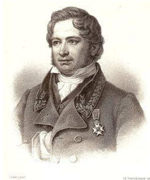
Erik Gustaf Geijer från ett litografi publicerad i Samlade skrifter 1875.