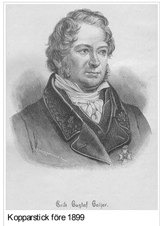
Kopparstick före 1899