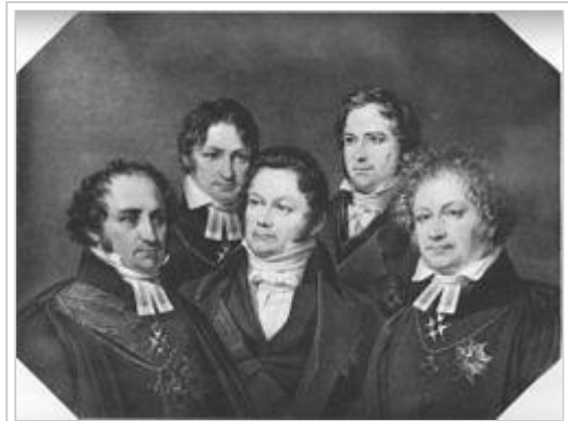
Fem av 1800-talets mest berömda svenskar. Från vänster: Johan Olof Wallin (ärkebiskop), Frans Michael Franzén (biskop), Jöns Jakob Berzelius (kemist), Erik Gustaf Geijer samt Esaias Tegnér (biskop).