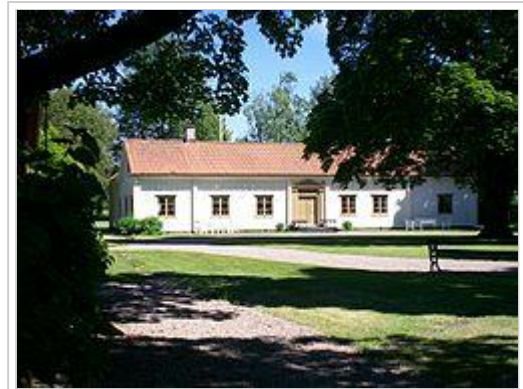
Geijersgården i Ransäter