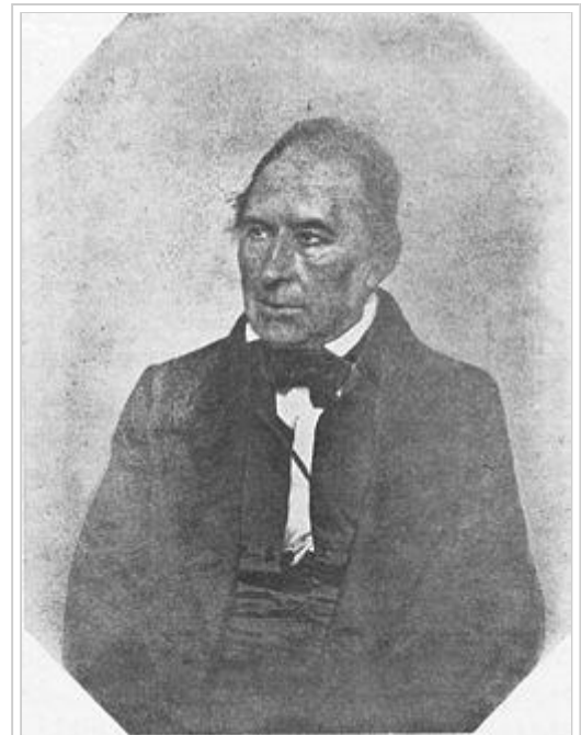
Erik Gustaf Geijer - Daguerrotyp från 1840-talet, Nationalmuseum