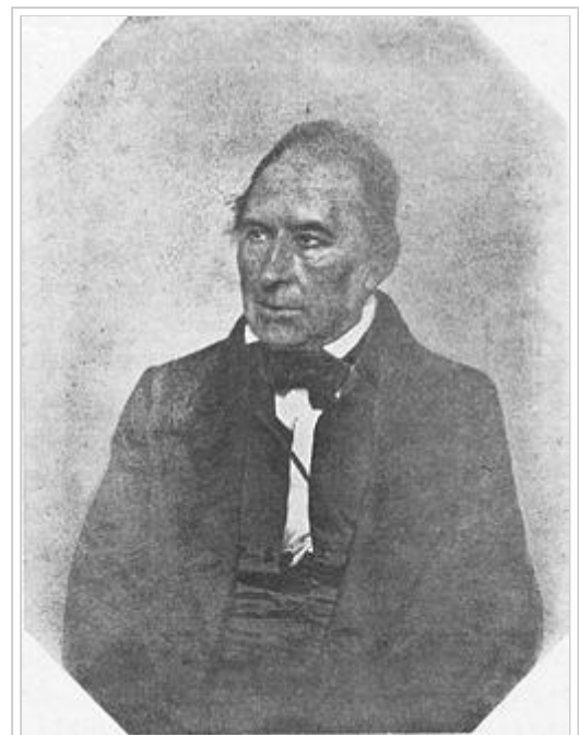
Erik Gustaf Geijer - Daguerrotyp från 1840-talet, Nationalmuseum