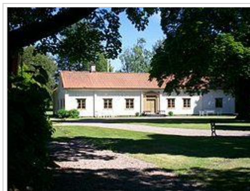
Geijersgården i Ransäter