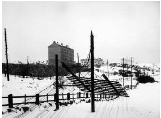
Södra stambanan mot öster omkr 1905. Nedblåst telefontalg vid Arbetsinrättningen.

Vid valet av plats hade man tvekat mellan stad och land, och Kungsholmen hade varit på tal, innan man stannade för det nersänkta området vid slutet av Hornsgatan. Det kasernliknande komplexet uppfördes under åren 1902-1905 och gav ursprungligen plats för 1.432 intagna.