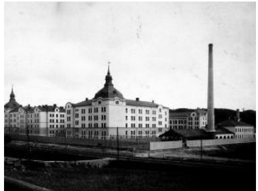
Stockholms Stads Arbetsinrättning 1905