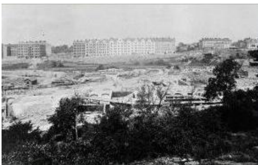
Byggnadsarbetena med Vårdhemmet Högalid påbörjas 1903. Bilden från söder.

Närmast kan arbetsinrättningen betraktas som en arvtogare till de gamla försörjningshusen med uppgift att bereda upphälle och nödhjälpsarbete för relativt arbetsföra män, som av olika anledningar - många är alkoholskadade - icke kan ta hand om sig själva. De sysselsätts med handräckning eller i anstaltens verkstäder och uppbär en blygsam timpenning. In- och utskrivning är helt frivillig - rekordet för en person skall vara 56 sådana på ett år - och medelåldern ligger mellan 50 och 60 år.